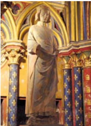
Statue du roi Louis IX - Saint-Louis Statue of King Louis IX - Saint-Louis

The Chaîne des Rôtisseurs, an international gastronomic society founded in Paris in 1950, traces its origin back to 1248. At that time, the French King Louis IX (later canonized as Saint Louis) wishing to thank the trades which had contributed to the construction of Sainte Chapelle, ordered the establishment of several professional guilds, including that of the "Oyeurs" or goose roasters. The vocation of this guild was to improve the technical knowledge of its members: apprentices, tradesmen and masters. Over the decades its activities and privileges were expanded. By 1509, during the reign of Louis XII, when the guild's knowledge was extended to include the preparation of other meats and poultry, including game, it took the name "Rôtisseurs" (roasters). In 1610, under the reign of Louis XIII, it was granted a Royal Charter and a coat of arms.