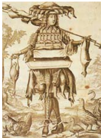
Tenue de Rôtisseur Rôtisseur's outfit