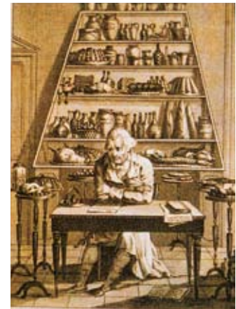
Méditations d'un gourmand Meditations of a gourmand